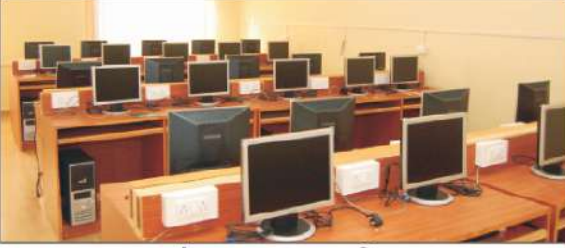
संगणक व wi-Fi सुविधा