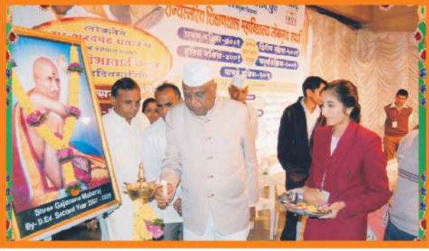
राज्यस्तरीय शिक्षणशास्त्र महाविद्यालय लोकनृत्य स्पर्धेचे उद्घाटन