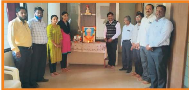
शिक्षक दिन २०२१