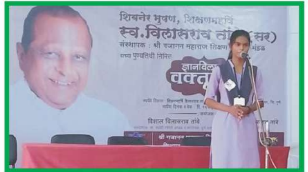
ज्ञान विलास वक्तृत्व स्पर्धेत सादरीकरण करताना सहभागी विद्यार्थी