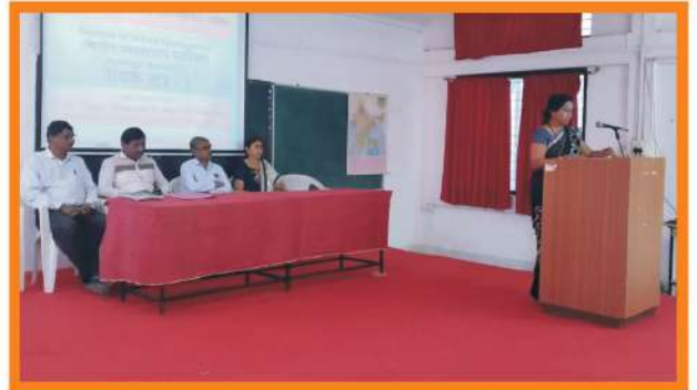
शालेय व्यवस्थापन पद्धतिका संपर्क सत्र