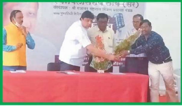
ज्ञान विलास वक्तृत्व स्पर्धेत मान्यवरांचा सत्कार