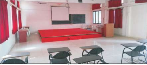
सुसज्ज सेमिनार हॉल