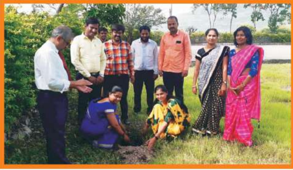
महाविद्यालय परिसरात वृक्षारोपण करताना