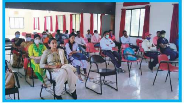
बी. एड. प्रथम वर्ष स्वागत समारंभामध्ये उपस्थित विद्यार्थी