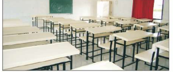
प्रशस्त अध्यापन कक्ष