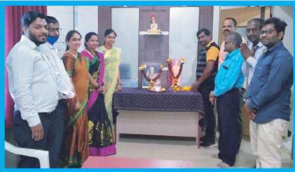
युवक दिन व जिजाऊ जयंती