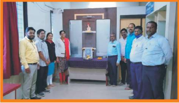
नेताजी सुभाषचंद्र भोस जयंती