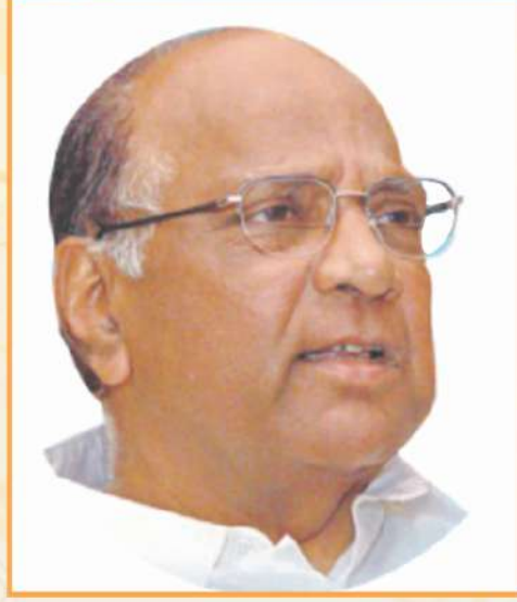
आदरणीय मा. शरदचंद्रजी पवार साहेब मा. कृषी मंत्री, भारत सरकार