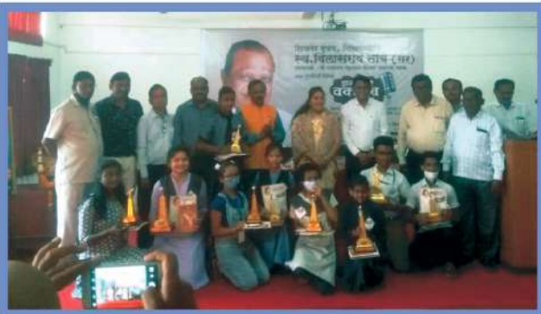
ज्ञान विलास वक्तृत्व स्पर्धेच्या विजेत्यांसह मान्यवर