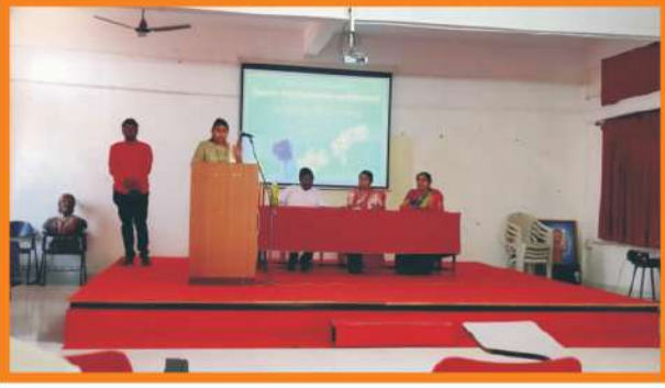
बी. एड. प्रथम वर्ष स्वागत समारंभामध्ये उपस्थित मान्यवर