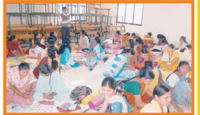
शैक्षणिक साहित्य निर्मिती कार्यशाळा