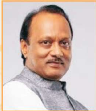
मा. ना. अजितदादा पवार साहेब उपमुख्यमंत्री, महाराष्ट्र राज्य