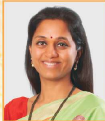
मा. सौ. सुप्रियाताई सुळे खासदार - बारामती