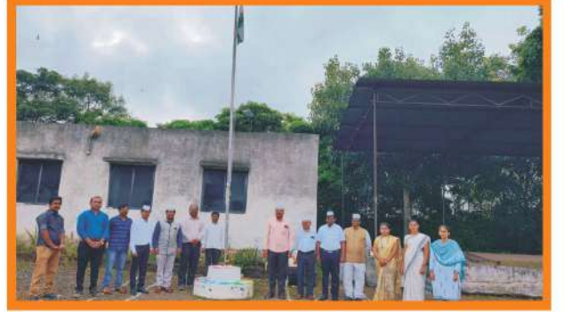
प्रजासत्ताक दिन २०२१